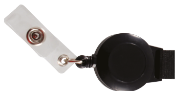
Zip intégré Badge reel Yoyo retractil