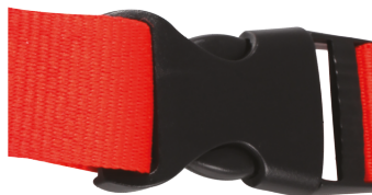
Boucle détachable Plastic detachable buckle Hebilla