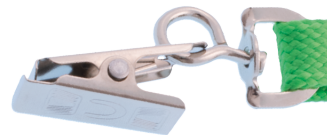
Pince croco Crocodile clip Pinza cocodrilo