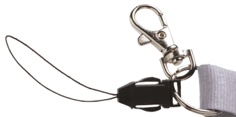
Mousqueton standard & attache téléphone Standard hook with mobile phone holder Mosquetón estándar y hebilla para teléfono móvil