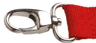
Mousqueton VIP VIP hook Mosquetón VIP