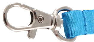
Mousqueton standard Standard hook Mosquetón estándar

Attachment, fixation & accessories - Soportes de sujeción, fijación y accesorios