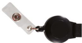
Zip intégré Badge reel Yoyo retractil