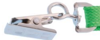
Pince croco Crocodile clip Pinza cocodrilo