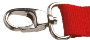
Mousqueton VIP VIP hook Mosquetón VIP