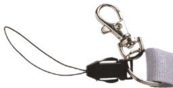
Mousqueton standard & attache téléphone Standard hook with mobile phone holder Mosquetón estándar y hebilla para teléfono móvil