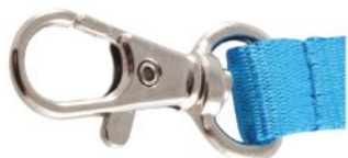
Mousqueton standard Standard hook Mosquetón estándar

Attachment, fixation & accessories - Soportes de sujeción, fijación y accesorios