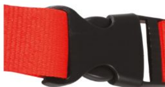
Boucle détachable Plastic detachable buckle Hebilla